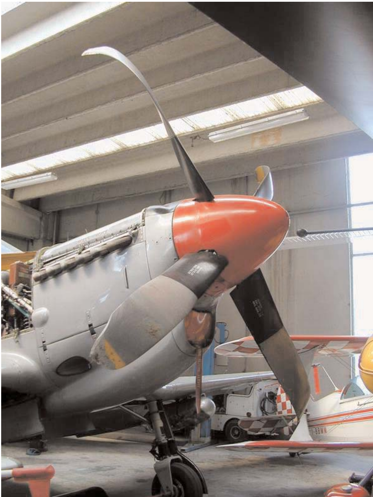
Parte anteriore velivolo danneggiato