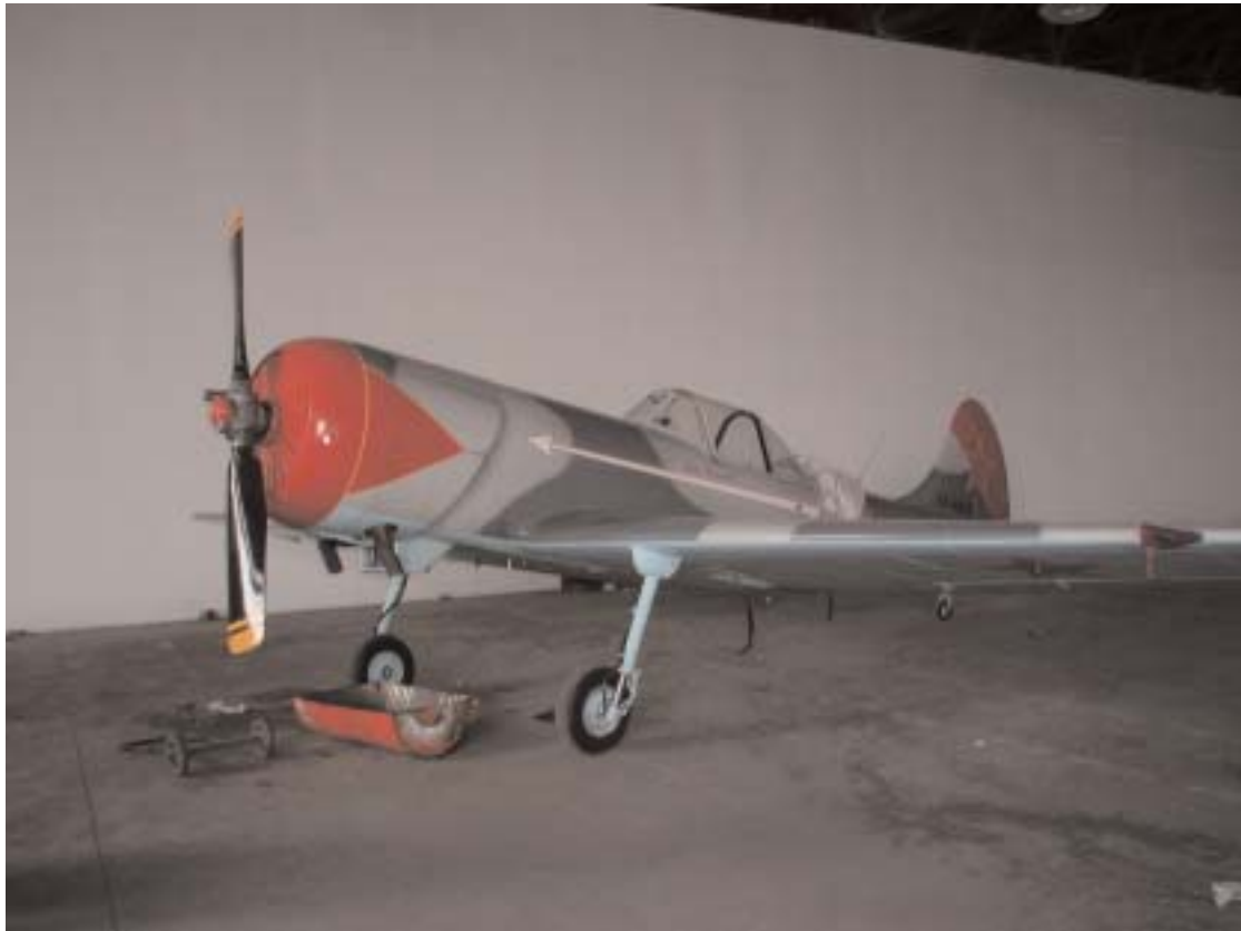
Vista anteriore sinistra dell'a/m incidentato