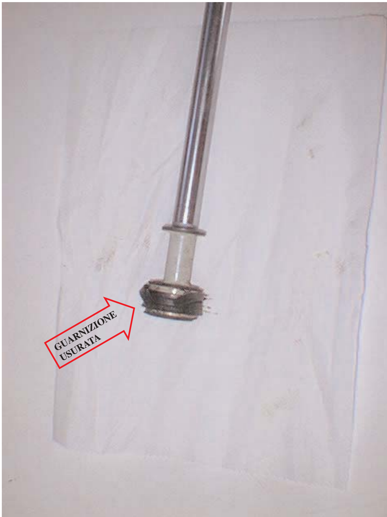
Particolare del pistone con guarnizione di tenuta usurata