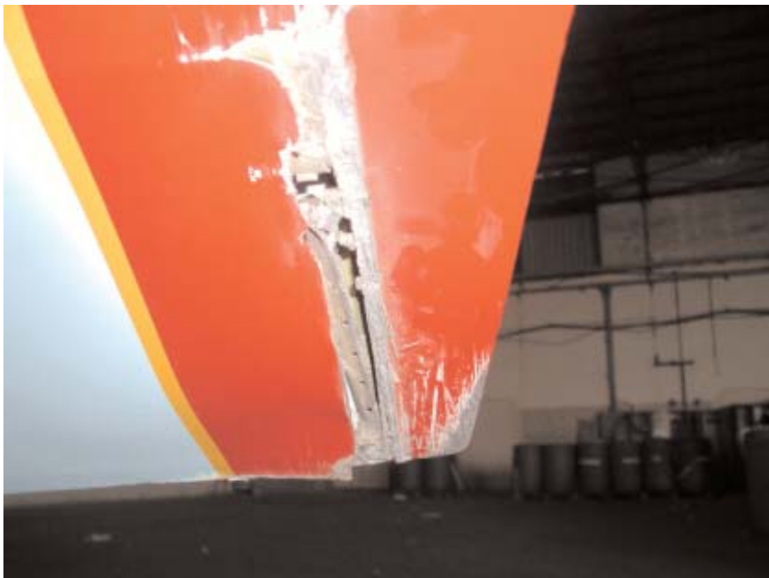
Particolare dell'alettone danneggiato