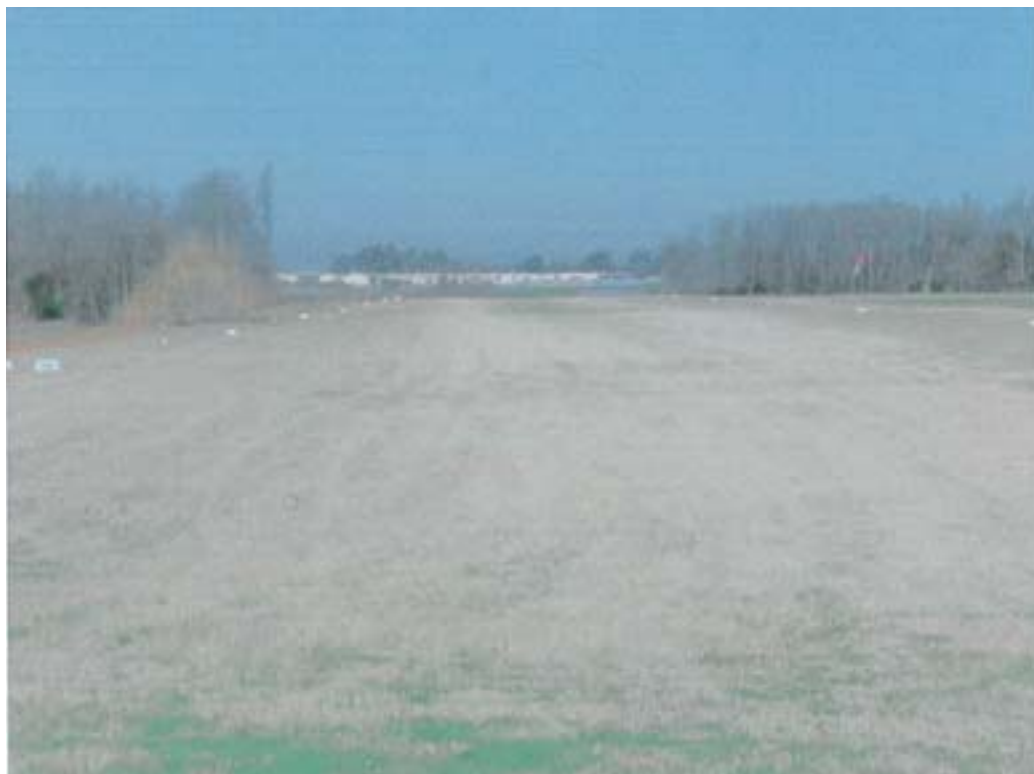
Aviosuperficie Sabaudia. Vista generale