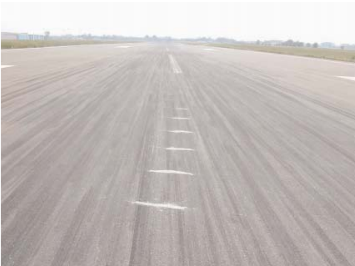
Abrasioni sul manto pista prodotte dall'elica