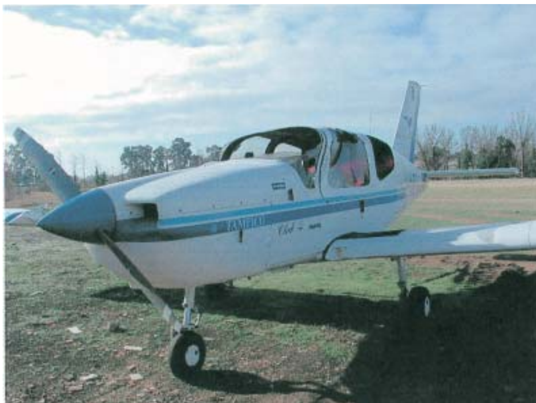
Vista anteriore sinistra dell'a/m danneggiato