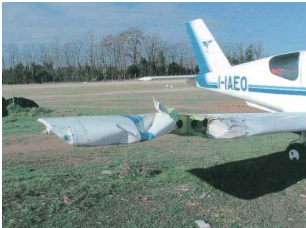
Particolare dell'ala destra danneggiata