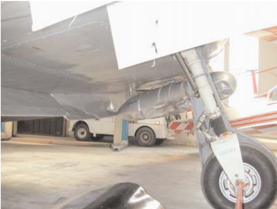
Danni parte ventrale a/m. Particolare