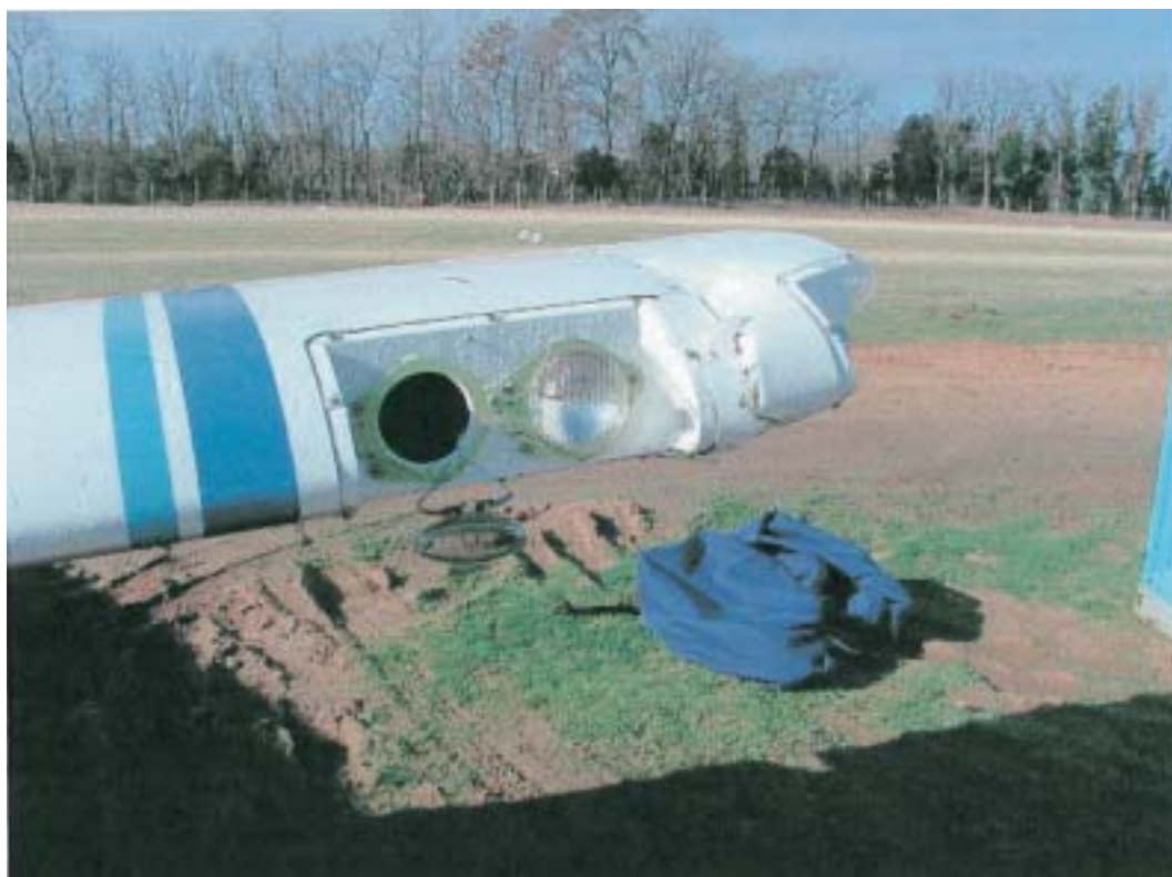
Particolare dell'ala sinistra danneggiata