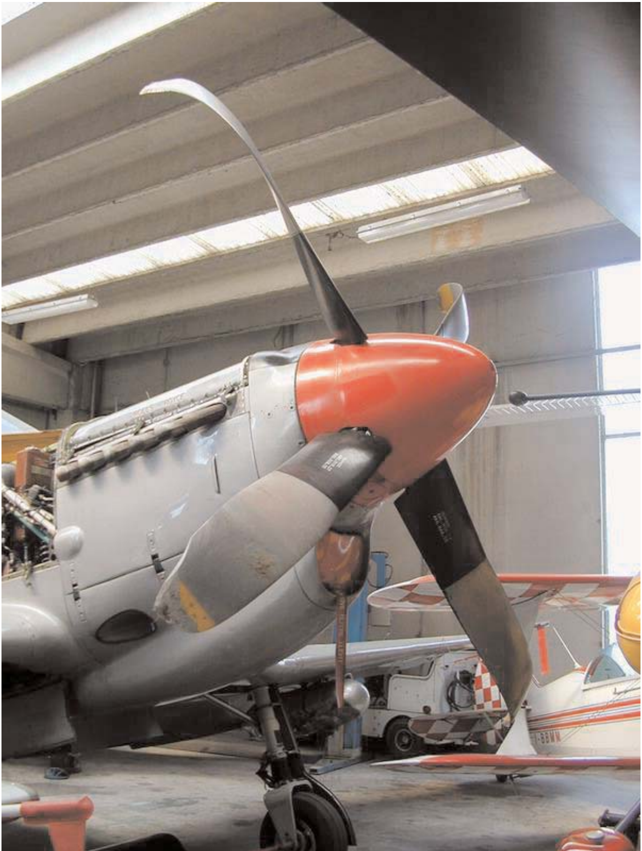
Parte anteriore velivolo danneggiato