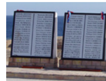
Monumento commemorativo dell'incidente di Sharm el-Sheikh (gennaio 2004)