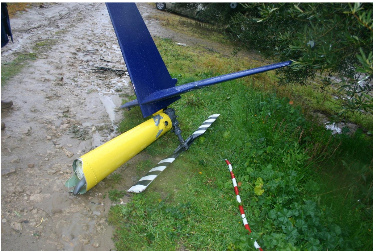
Foto 3: parte terminale del trave di coda del F-GUJB, con impennaggi e rotore di coda.