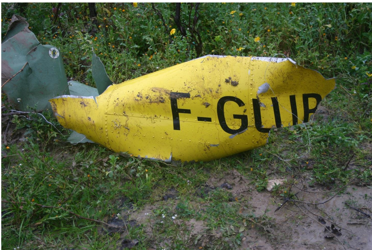
Foto 4: parte del trave di coda dell'elicottero, con marche di identificazione dello stesso.