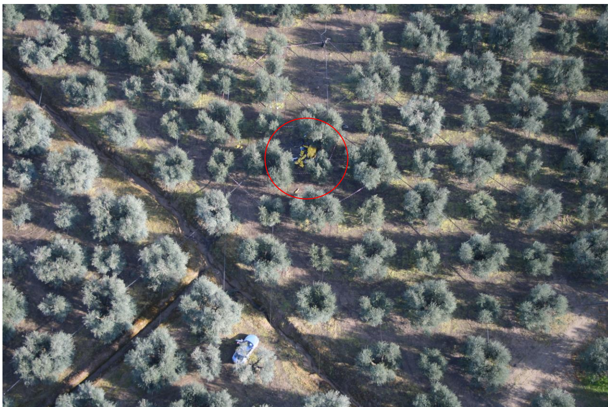
Foto 1: ripresa aerea del luogo dell'incidente; al centro, il relitto principale dell'elicottero.